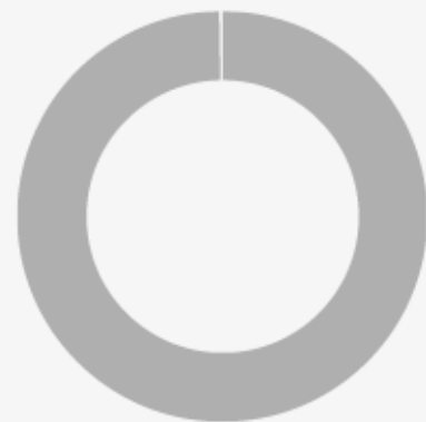
2. Taxonomie-Konformität der Investitionen ohne Staatsanleihen

■ Taxonomiekonform ■ Andere Investitionen