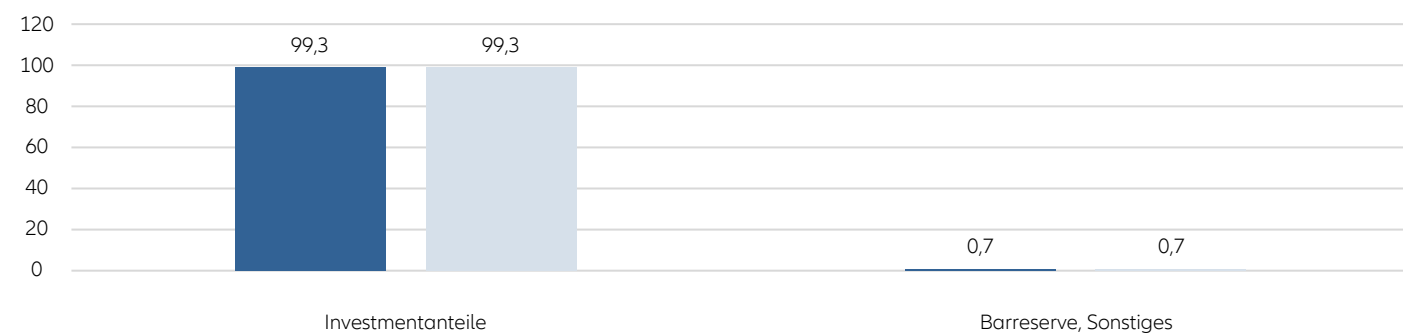
Struktur des Fondsvermögens in %

■ zum Geschäftsjahresanfang ■ zum Berichtsstichtag