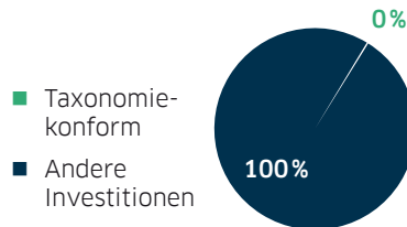
1. Taxonomiekonformität der Investitionen einschließlich Staatsanleihen *)